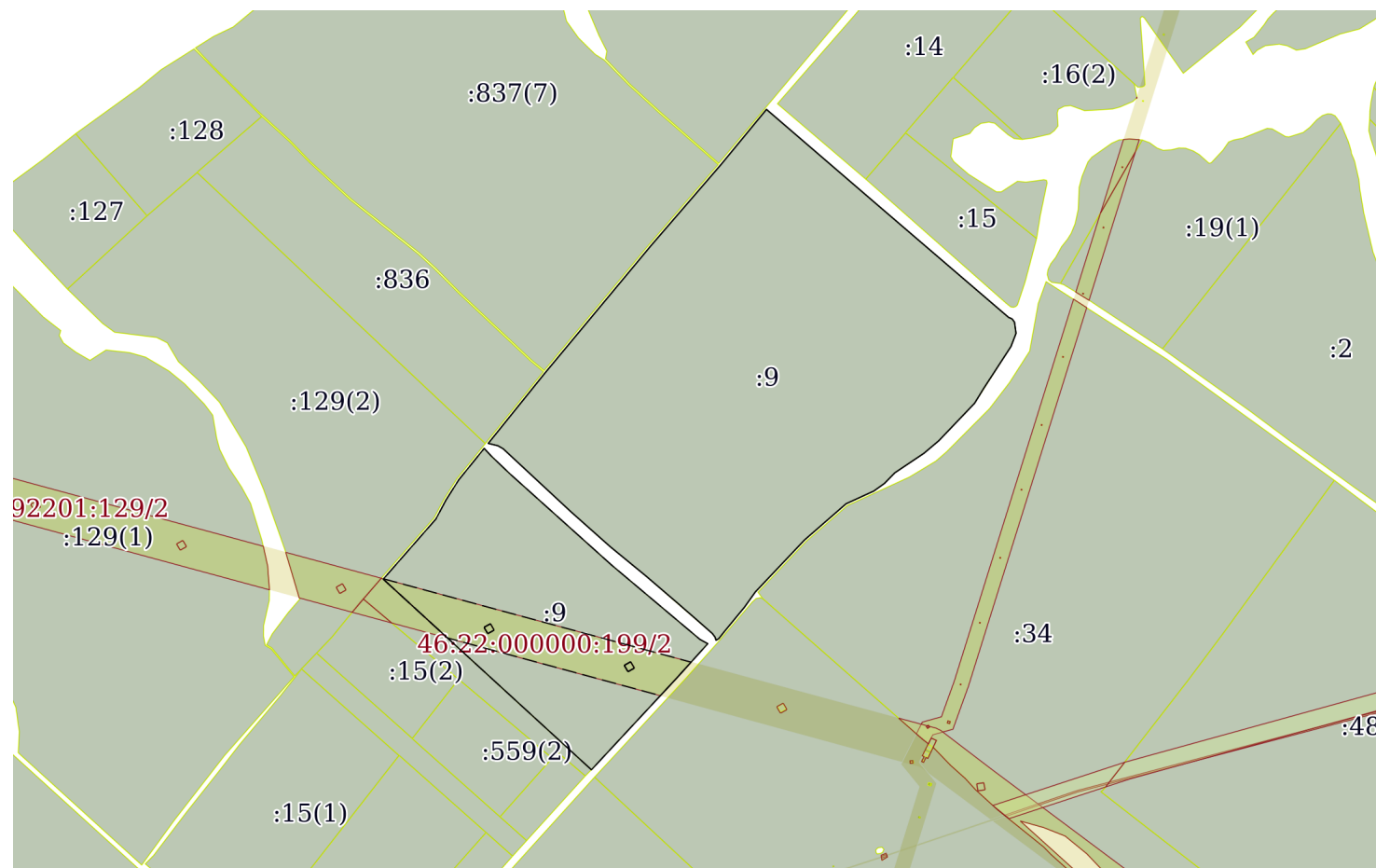
План (чертеж, схема) земельного участка

Кадастровый номер: 46:22:000000:199(Единое землепользование)